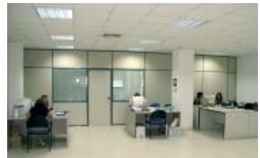
Imágenes del Centro de Formación