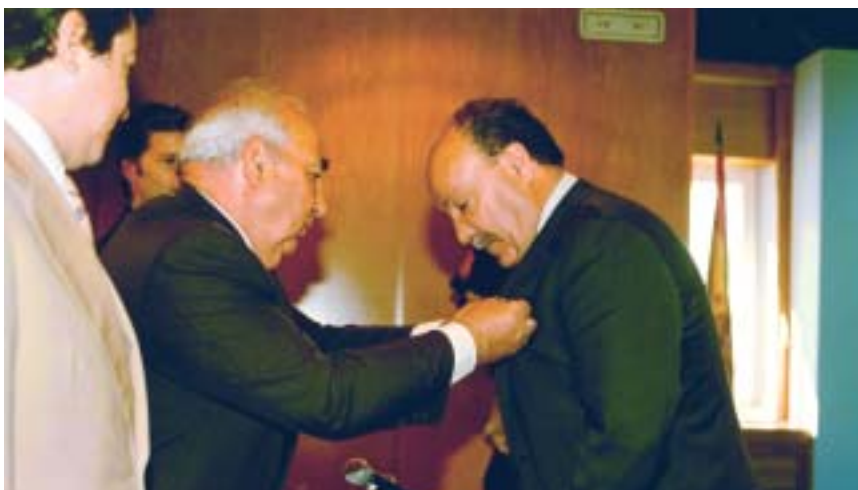
El Delegado del Gobierno en Madrid impone la medalla al Alcalde roceño

El Alcalde de Las Rozas recibió la Medalla de manos del Delegado del Gobierno en Madrid, en la sede del Instituto Superior de Estudios de Seguridad de la Comunidad de Madrid.